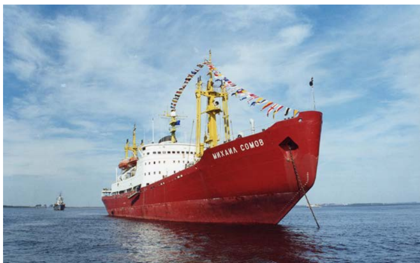
На рейде в день ВМФ и торжественной отправки экспедиции – 30 июля 2000 года