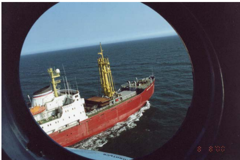
В Печорском море – с вертолета по пути из Нарьян-Мара – 8 августа 2000 года