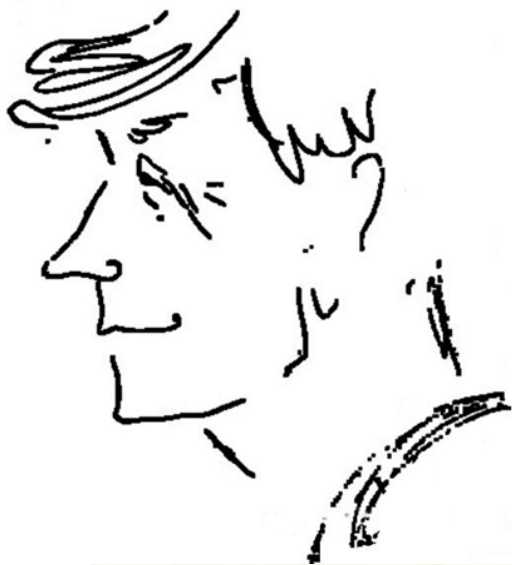
Работа Н.М. Перовой, середина 70-х годов