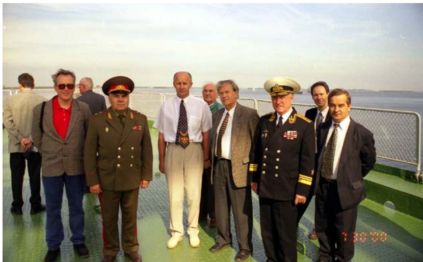
30 июля 2000 года – на борту теплохода «Михаил Сомов» – торжественная отправка экспедиции в рейс в день ВМФ, г. Архангельск, морской порт, главный рейд