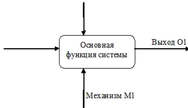
Рис. 2. Контекстная диаграмма графической модели

«запускает» и поддерживает её функционирование. Такой аспект приводит к вопросу: где именно в графической модели будет расположен механизм государственной поддержки предпринимательских структур? Он займет всю модель или только её часть (нижние дуги)?