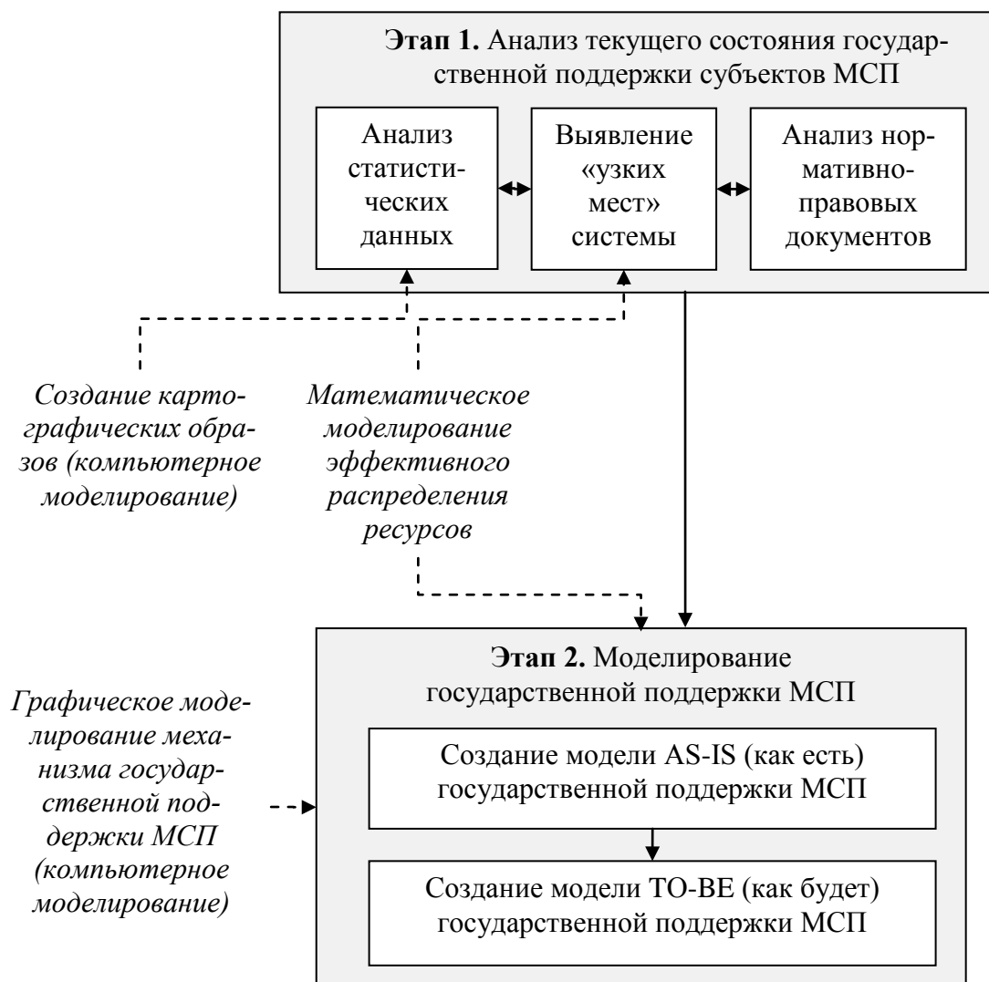
Рис. 4. Этапы и инструментарий исследования по совершенствованию и механизма государственной поддержки субъектов МСП

Однако научные изыскания должны базироваться и на математическом моделировании. При формировании программ государственной поддержки субъектов МСП практическое значение имеет прогнозирование развития экономических процессов, которое покажет предполагаемые результаты государственной поддержки.