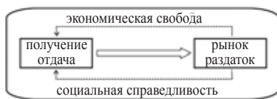
Рис. 2. Концептуальная рамка новой парадигмы

В рынке «получение» превалирует над «отдачей», личная мотивация прибыли обеспечивает реализацию общественных потребностей. В раздатке – мотивация служения обеспечивает доминирование отношений «отдач» над «получениями». Оба типа экономик всегда сосуществовали, дополняли друг друга или временно замещали на разных отрезках времени. Рынок и раздаток – два базовых механизма координации, над которыми человечество