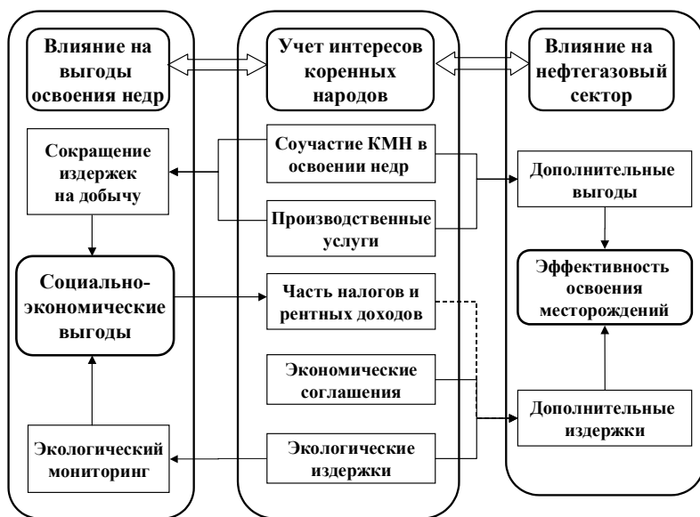
Рис. 7. Потенциальные выгоды и издержки основных участников процессов недропользования на ТТП

Место и роль рассматриваемых направлений во взаимосвязи с их влиянием на общие выгоды общества и на эффективность освоения месторождений с позиций недропользователей представлены на рис. 7.