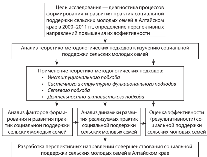
Рис. 4.1. Логическая схема исследования процессов формирования и развития практик социальной поддержки сельских молодых семей в Алтайском крае в 2000–2011 гг.

В социологии семьи для исследования репродуктивного поведения личности и семьи создано множество технических приемов и средств. Одним из способов изучения репродуктивного поведения является анализ таких показателей, как «идеальное», «желаемое» и «ожидаемое» число детей в семье. Истоки его происхождения уходят в 30-е гг. 20 в. «Идеальное число» трактуется как отражение социальной нормы детности, «желаемое число» — как индикатор потребности в детях, «ожидаемое число» — как установочные ориентации, репродуктивные установки, прогнозирующие тенденции рождаемости.