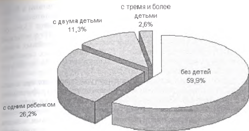
Рис. 5.1. Структура российских домохозяйств по числу детей в 2002 г.